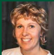
ERATH MAGDALENA, 403